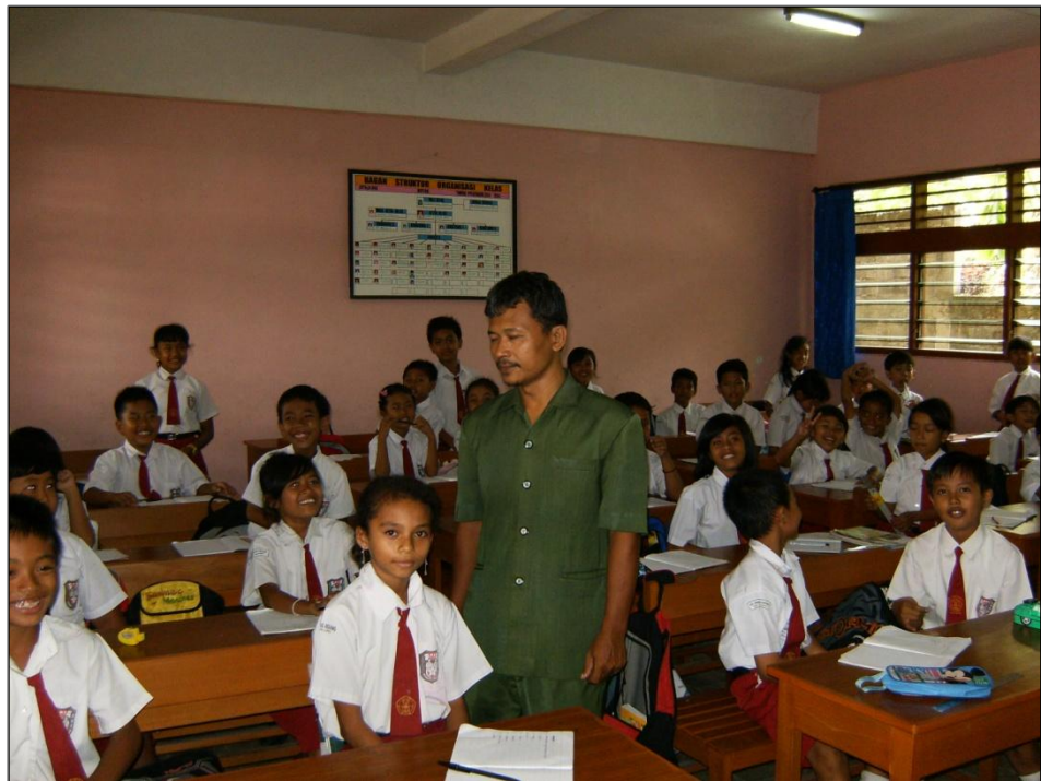
Basisschool van het weeshuis in Tuka (Bali)