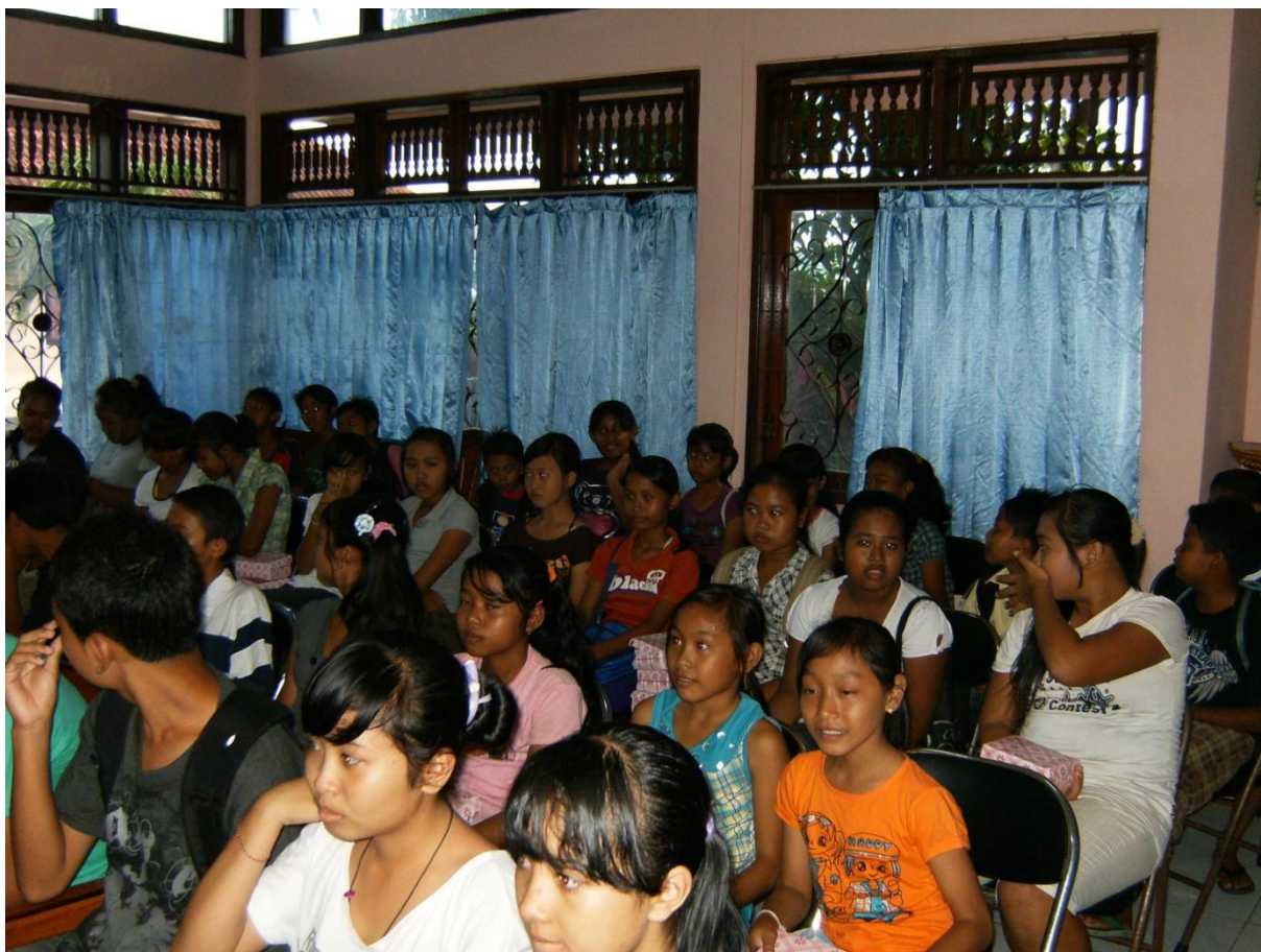
Uitreiking van de certificaten Engels in het gemeentehuis van Cemagi