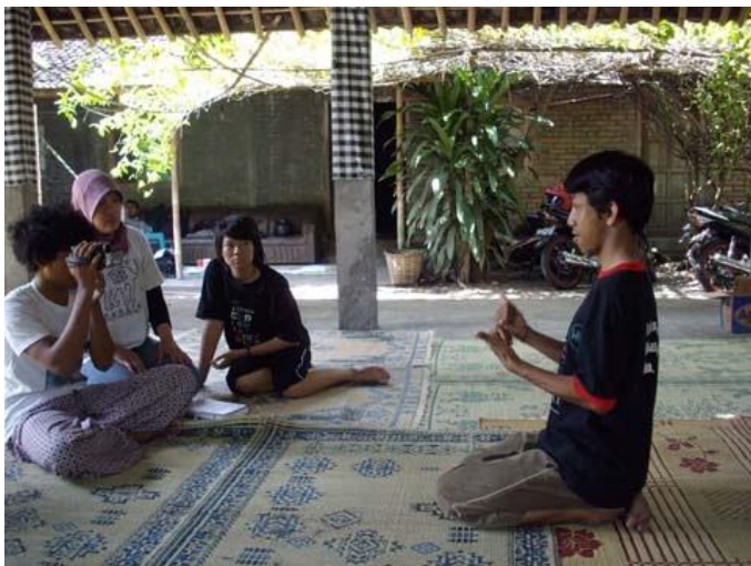
Dove kinderen leren gebarentaal op Bali.